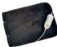
HEATED PAD AD 7433